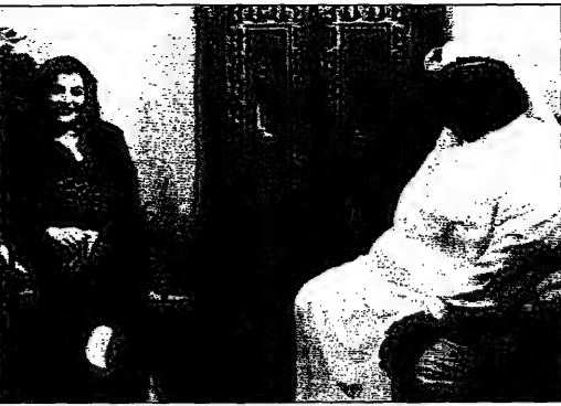
في مملكة من الخفاف العجيب التي جعلها ضيفاً (فانت عزام)

بانت عزام، من جبهات الاعلامية والصحفية الكاتبة مراديا... مملكة من الخفاف العجيب التي جعلها ضيفاً (فانت عزام)